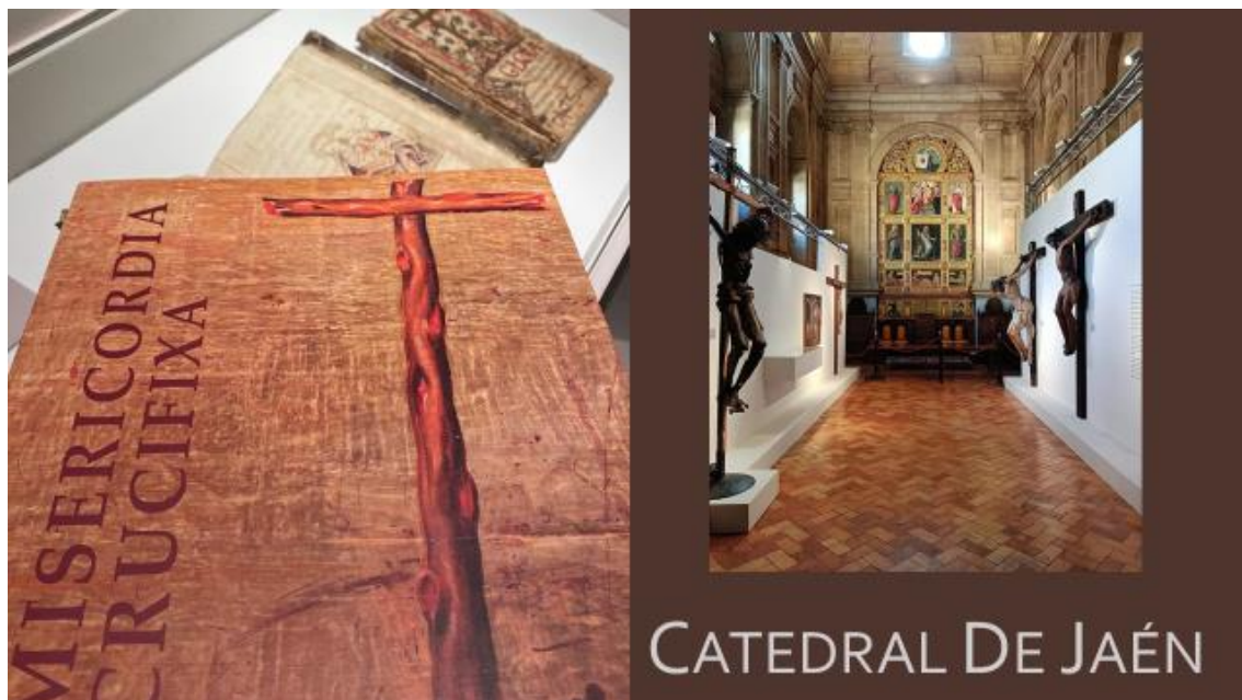
CATEDRAL DE JAÉN

Junto a esta casa, junto a la Universidad de Jaén hemos creado la Cátedra Andrés de Vandelvira que pretende promover e impulsar el conocimiento, difusión, valoración y transferencia de los estudios sobre Humanismo, Renacimiento y Barroco entre los siglos XVI y XVIII. Catedra que ha tenido ya sus frutos en ciclos de conferencias como las llevadas a cabo con motivo de la exposición Al Hilo de la seda , publicaciones de libros como el muy reciente entorno a la obra de Pedro Machuca. Así como otras actividades que estamos preparando de manera conjunta para los próximos meses y que quieren ser un impulso al conocimiento de la huella que dejó Vandelvira en los arquitectos posteriores a él, una debilidad plasmada por la Unesco en el expediente para conseguir la denominación de la Catedral de Jaén como Patrimonio de la Humanidad.